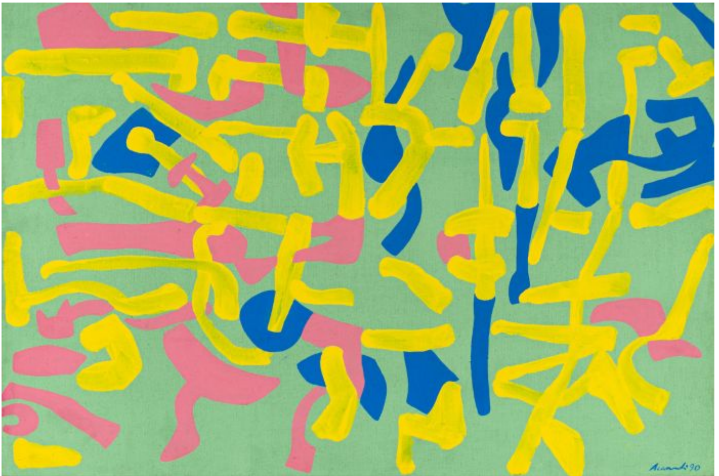
Carla Accardi, Senza titolo , 1990.

Un'asta online per inaugurare il nuovo dipartimento dedicato all'Arte Antica della casa milanese e le anticipazioni sulla vendita di Arte Moderna e Contemporanea