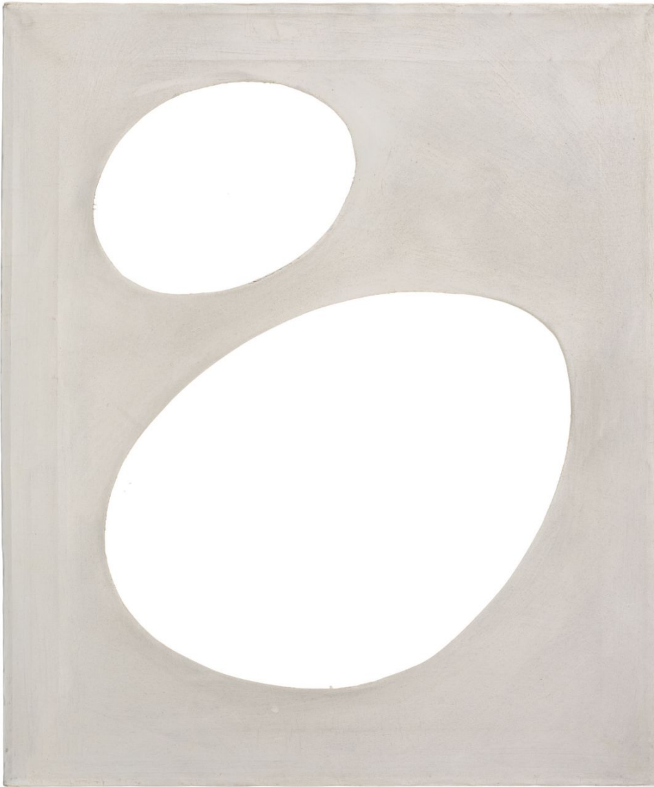
Dadamaino, Volume 1958 , post 1965.