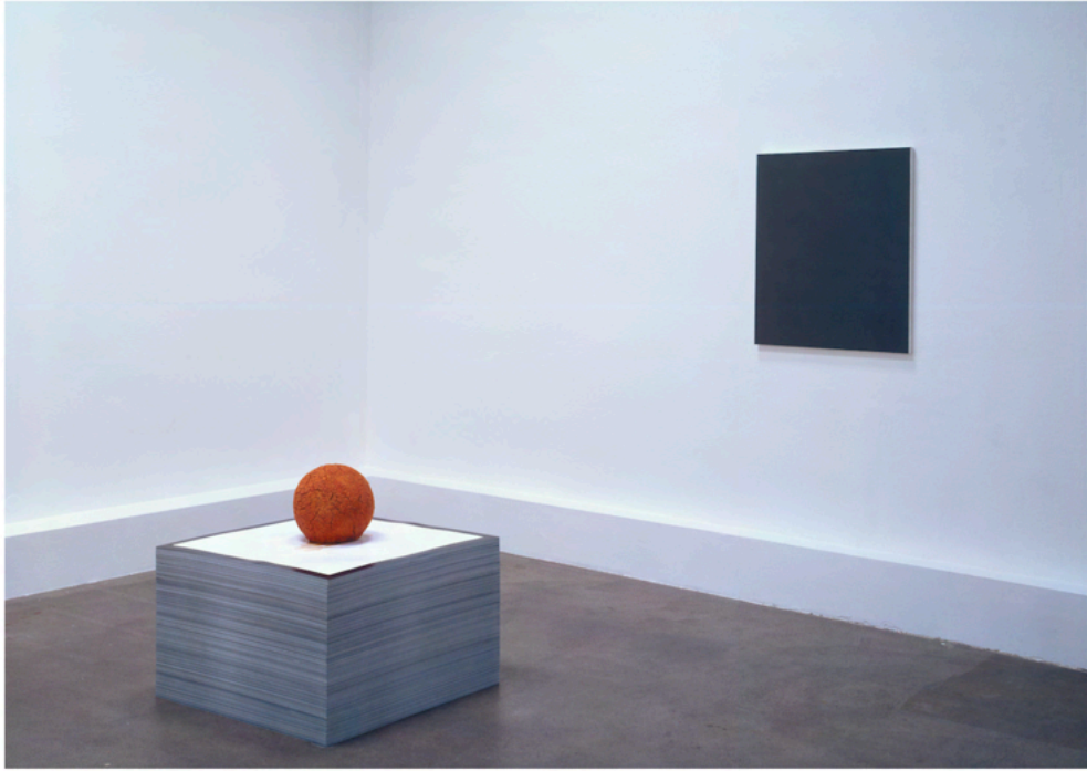
Pietro Roccasalva, D'apres la tempesta, 2006.